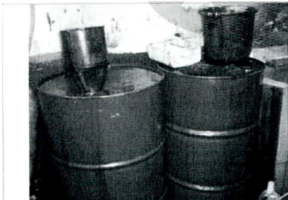
Foto 3. Almacenamiento de aceite usado